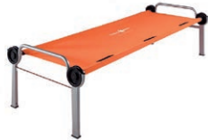
In 5 Min aufgebaut