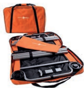
verpackt in der Tasche