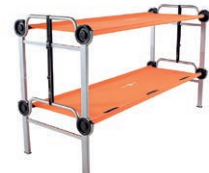
Als Etagenbett aufstellbar